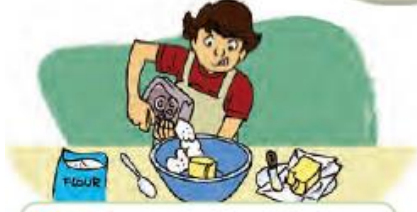
Put sugar and butter in a bowl.

Recipe: Chocolate chip biscuits 2 eggs 200 grams of butter 300 grams of sugar 300 grams of flour 250 grams of chocolate chips