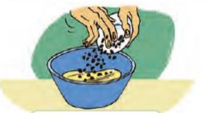
Add chocolate chips.