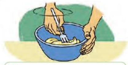
Mix butter and sugar with a fork.