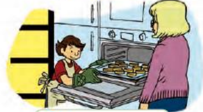
Bake for 20 minutes.