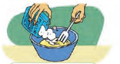
Slowly add flour and mix.