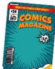
a comic magazine