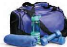
a gym kit