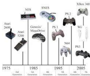
Ejemplos línea De tiempo

En la parte inferior derecha anota nombre, curso y Asignatura.