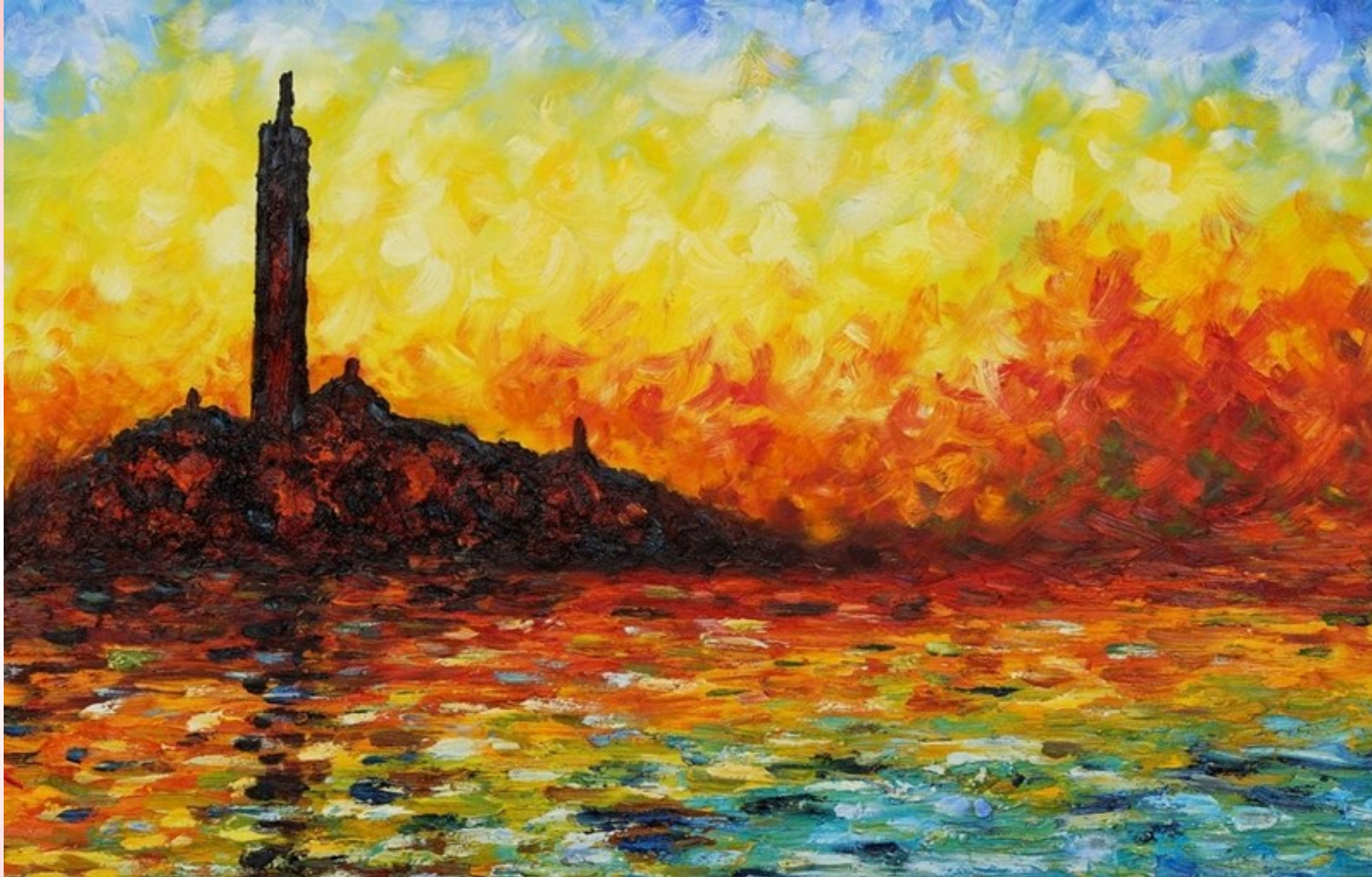
Claude Monet "Puesta de sol en Venecia"