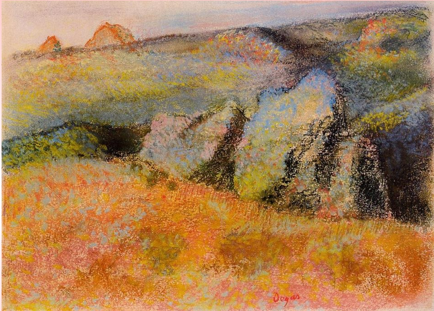
Edgar Degas "Paisaje con rocas"