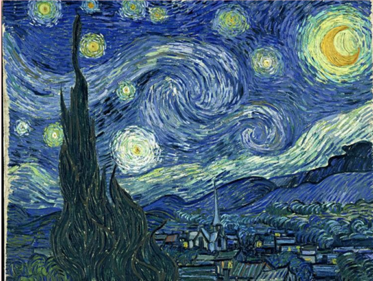
Vincent van Gogh “La Noche Estrellada”