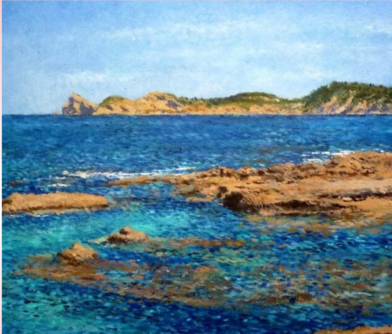
Auguste Renoir “Cabo de San Martín”