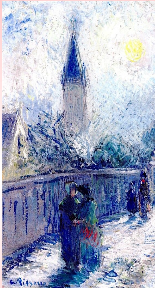
Camilla Pisarro “Londres, Iglesia de todos los Santos”