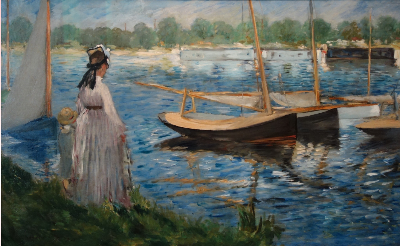
Édouard Manet « La Seine à Argenteuil »