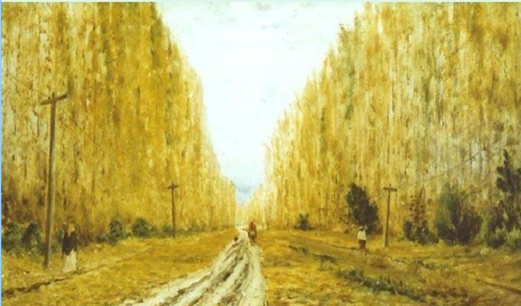
Alfredo Valenzuela Puelma "Alameda de Peñaflores"