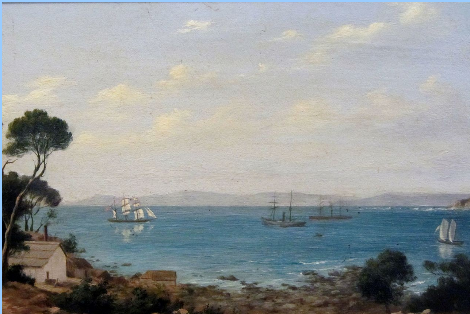
Onofre Jarpa "Puerto de Lebu"