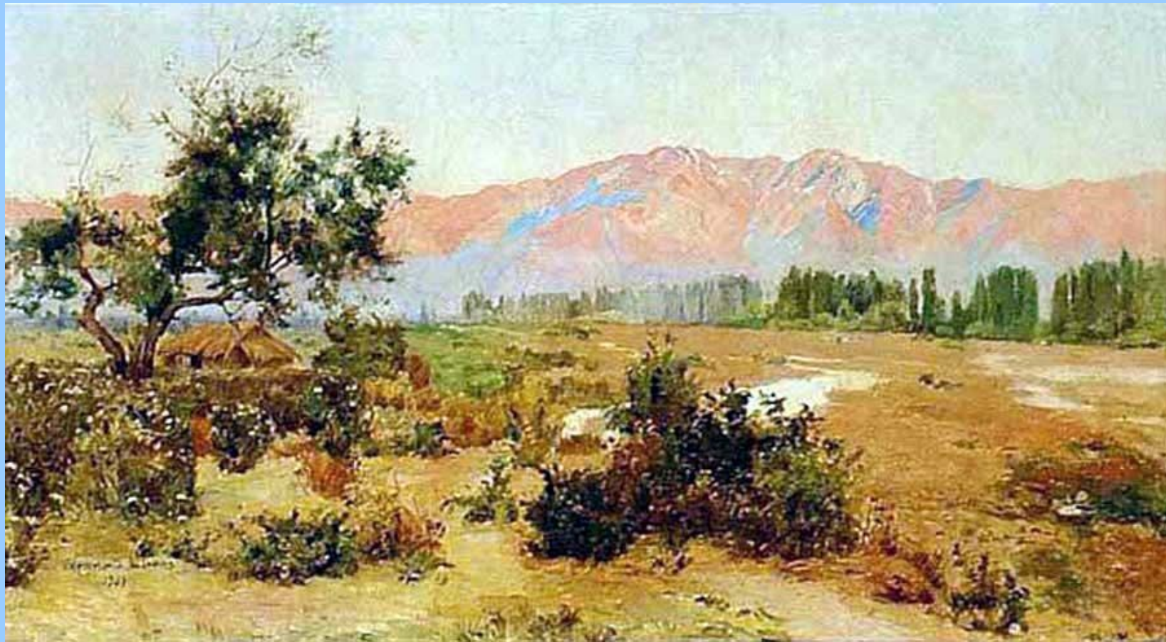
Alberto Valenzuela Llanos (Chile, 1856-1909) "Paisaje con Cordillera"