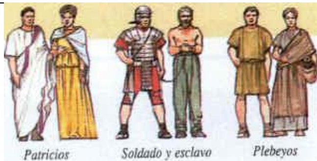
LAS CLASES SOCIALES EN LA ANTIGUA ROMA