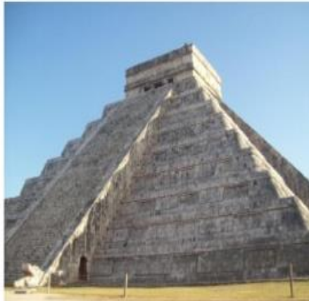
La pir mide de Chich n Itz , se encuentra de acuerdo a la ubicaci n del sol durante los equinoccios de primavera y oto o. Al ponerse el sol en estos dos d as, la pir mide proyecta una sombra de s  mismo que se alinea formando una cabeza de serpiente el dios maya Kukulk n. La sombra forma el cuerpo de la serpiente que parece deslizarse.

Por otra parte, encontramos avances notables que realiz  la astronom a maya como fue la capacidad de predecir eclipses, determinar el movimiento del sol, la luna (estableciendo la duraci n del a o lunar y del a o solar), adem s llegaron a calcular la duraci n del a o de Venus planeta al cual le asignaban una gran importancia en la determinaci n de guerras y sacrificios.