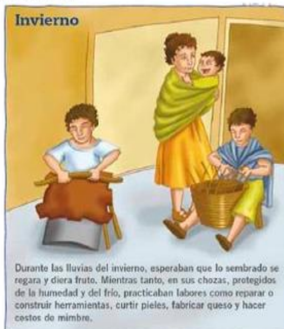
Durante las lluvias del invierno, esperaban que lo sembrado se regara y diera fruto. Mientras tanto, en sus chozas, protegidos de la humedad y del frío, practicaban labores como reparar o construir herramientas, curtir pieles, fabricar queso y hacer cestos de mimbre.

1. Pinta con rojo los productos que consumían los antiguos romanos. Identificar