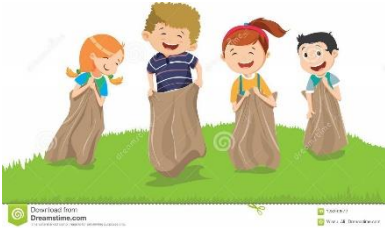
Carrera en saco