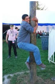
El palo encebado