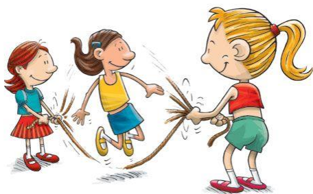
Saltar la cuerda