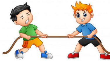
Tirar la cuerda