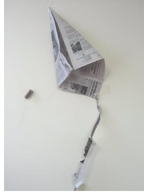
Chonchón o chonquita