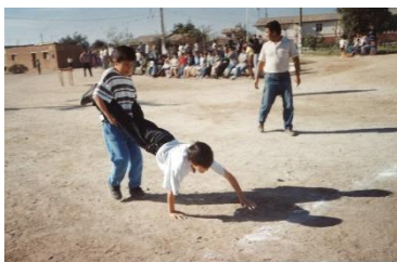
Carrera en carretilla