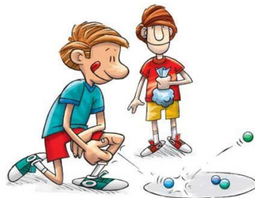
Bolitas, canicas, polcas o tiritos