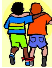
Carrera a 3 pies