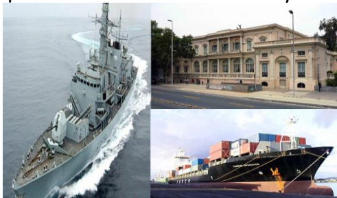
1.- Barco de Guerra. 2.- Embajada. 3.- Barco mercante

2. TERRITORIO JURIDICO: Formado por embajadores, buques de guerra, barcos mercantes que lleven la bandera nacional y el transporte aéreo nacional.